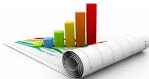
Valutazione di Sistema e Autovalutazione d'Istituto

Il Piano dell'Offerta Formativa (POF) è un documento programmatico vitale e dinamico: prevede momenti di verifica in itinere, intermedia e finale, ai fini di un progressivo adeguamento e miglioramento.