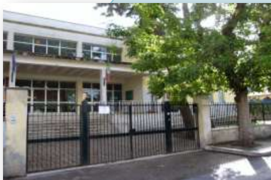
Infanzia e primaria F. Lama