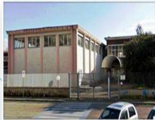
Infanzia e Primaria G. Manzi