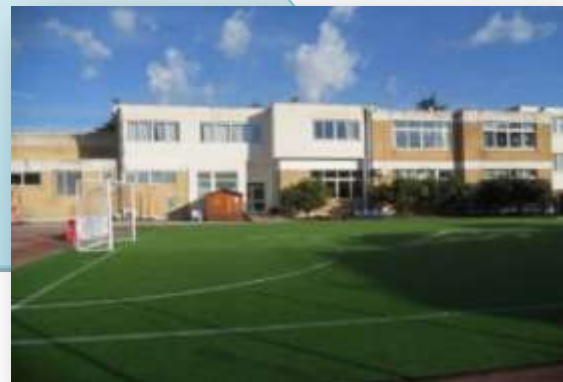
Sede Centrale Scuola Secondaria di primo grado Don Lorenzo Milani