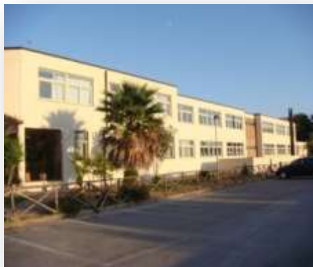
Infanzia e primaria G. Paolo II